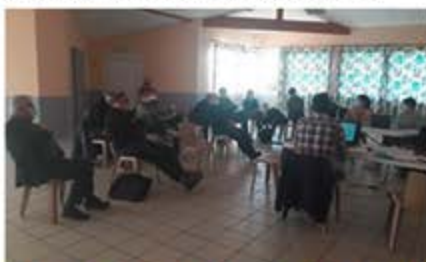
Lundi 23 novembre 2020 après-midi, le premier COFIL (Comité de pilotage) de l'étude du fonctionnement hydraulique du Saleys composés d'élus et de techniciens s'est réuni

Par la suite, un processus de concertation avec la population locale devait être enclenché en janvier 2021. Hélas, la situation sanitaire de cette période a perturbé le planning prévu et la concertation n'a pu se faire qu'à l'automne 2021 : cela se traduira par des ateliers de travail thématiques en petits groupes et des réunions publiques.