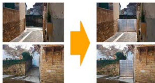
Fermer les accès au Saleys par des barrières anti-inondations