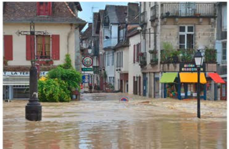
Pont et rue Loumé le 13 juin 2018

Le dialogue territorial s'est donc déroulé fin 2021 selon le calendrier suivant :