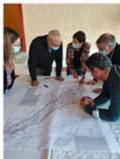
Atelier du 12/10/2023 - définition des enjeux et vulnérabilité